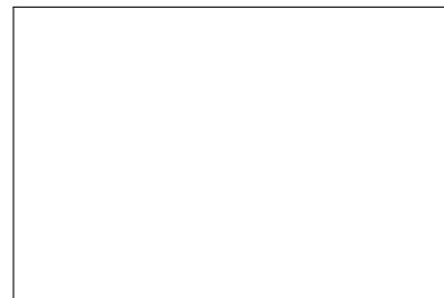
Figure 1: An example of figure

Lorem ipsum dolor sit amet, consectetur adipiscing elit. Quisque scelerisque porta diam. Suspendisse vel metus sit amet dui mollis lacinia vel a urna. In pretium ante tristique urna accumsan, iaculis consectetur eros iaculis. Suspendisse sit amet mi libero. Maecenas odio arcu, dignissim id porta tristique, porttitor in orci. Proin ex nibh, efficitur quis gravida eget, fringilla in metus. Pellentesque velit tortor, luctus eget erat at, feugiat feugiat quam. Fusce a enim quam. Donec porta volutpat purus vel fringilla. Aenean et maximus lorem. Praesent feugiat semper consectetur. Integer magna est, semper et ullamcorper at, elementum